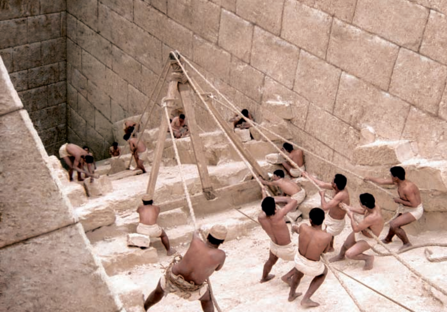
Der NDR „dokumentiert“ in der Koproduktion Die Pyramide zusammen mit der BBC das Leben der Bauarbeiter im alten Ägypten.