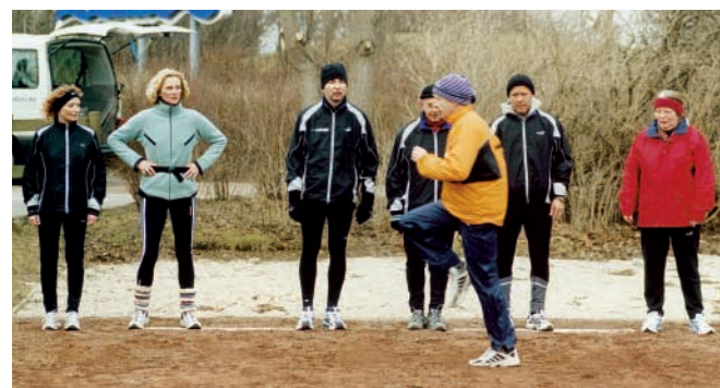
In der Doku-Soap Von 0 auf 42 greifen Team und Kamera ganz bewusst in das Leben der Protagonisten ein: sie laufen für die Bilder.

ARD ausgestrahlt wurde. Für die neue Langzeit-Doku-Soap Von 0 auf 42 – Marathongeschichten aus Deutschland und New York bewarben sich 17.000 Menschen, um innerhalb eines Jahres vom Couchpotato zum Marathonläufer zu werden. Sechs völlig verschiedene Leute wurden ausgewählt und medizinisch untersucht, bevor ihr Leben während dieses Jahres dokumentiert wurde. Gedreht wurde einerseits mit einer Digi-Beta, im Format 16:9 und andererseits – von den Protagonisten selbst – mit Mini-DV Kameras im Format 4:3. Gedreht wurden auch alle Probleme, die in der Familie, im Job, oder mit der Gesundheit auftauchten. Das Er-Leben der Protagonisten steht im Mittelpunkt, weniger der sportliche Hintergrund. Ziel ist auch mit Hilfe von Animationen dem Zuschauer Wissen zu vermitteln, über das was im Körper geschieht. Zum Beispiel wenn er Muskelkater hat, Fettzellen abbaut, oder wenn der „Mann mit dem Hammer kommt“, also der Läufer nicht mehr einen einzigen Schritt weiter kann. Die Serie wird dreimal 45 Minuten lang sein und 2004 ausgestrahlt.